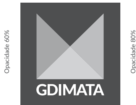
Versão monocromática negativa